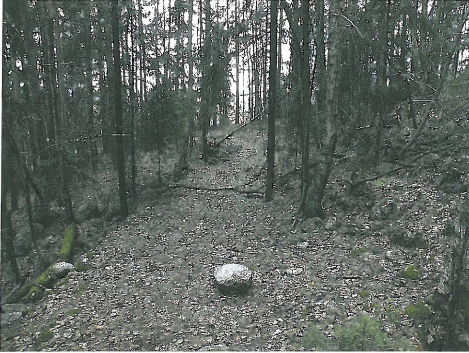
Kuva 2. Väylä, johon Ruumiinpuntari-nimitys muistitiedon mukaan liitetään kuvattuna pohjoiskoillisesta. 22.4.2010