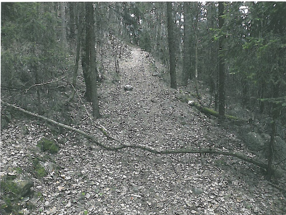
Kuva 1. Väylä, johon Ruumiinpuntari-nimitys muistitiedon mukaan liitetään kuvattuna etelälounaasta. 22.4.2010

Muistitieto liittyy Ruumiinpuntari-nimityksen yhä nykyään maastossa näkyvään väylään yli Epilänharjun. Arkistolähteiden perusteella ei nimityksen ja maastossa näkyvän ja oppaiden esittelemän väylän yhteyttä voitu kuitenkaan varmentaa. Kohteella on mahdollisesti paikallista liikennehistoriallista ja muistoarvoa vanhana kirkko- ja markkinatienä, mutta sen merkitys ei ole valtakunnallisesti huomattava. Kohde ei näin ollen täytä kiinteälle muinaisjäännökselle asetettuja kriteereitä.