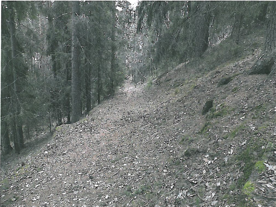
Kuva 3. Väylä, johon Ruumiinpuntari-nimitys muistitiedon mukaan liitetään kuvattuna pohjoiskoillisesta. 22.4.2010