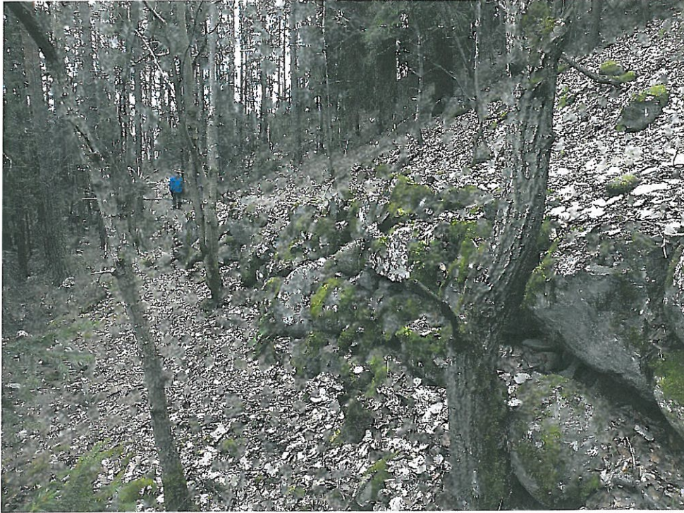
Kuva 4. Väylään, johon Ruumiinpuntari-nimitys muistitiedon mukaan liitetään, kuuluva kivipenger. Kuvattu itäkoillisesta. 22.4.2010