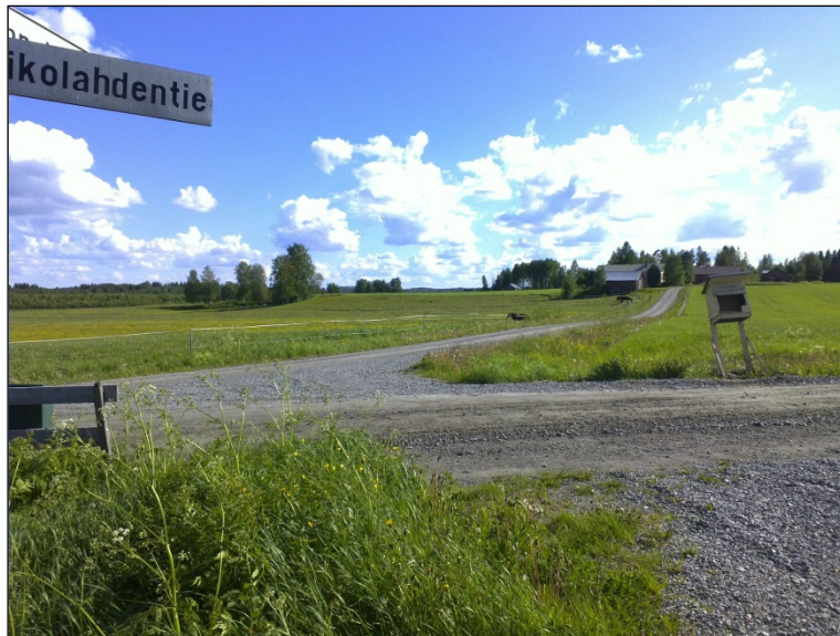
Löytöpaikka 32 jossa taustalla selkeästi erottuvan muinaisrantatörmän päällä. Lounaaseen.