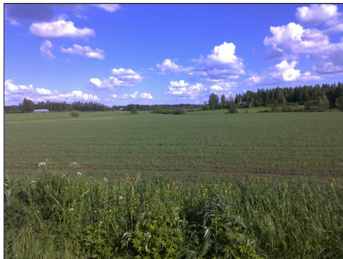
Löytöpaikan nro 31 maisemaa (ks. yleiskartta), kaakkoon