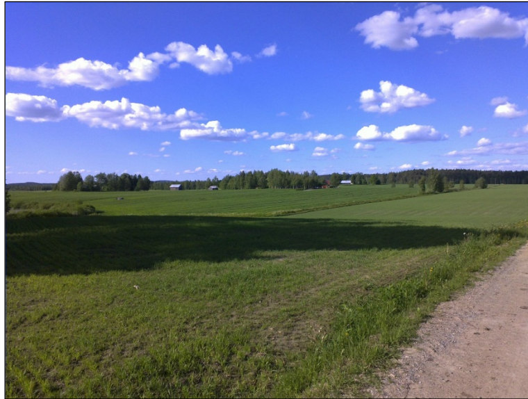
Löytöpaikan 31 maisemaa toisesta suunnasta., lounaaseen.