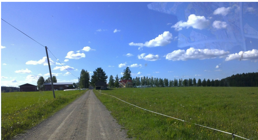
Löytöpaikan 33 maisemaa, pohjois-luoteeseen.