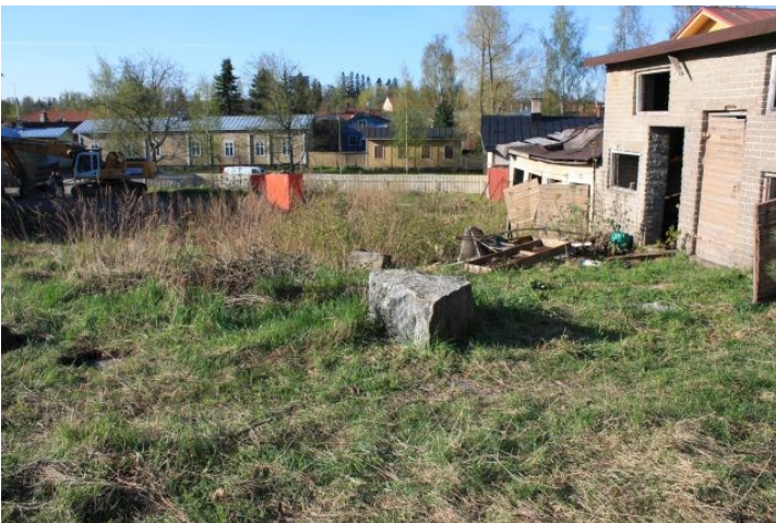
AKDG3158:1. Rauman Pohjankatu 20 tonttialuetta ennen tutkimusten alkua. Kuvattu tontin luoteisnurkasta etelään.