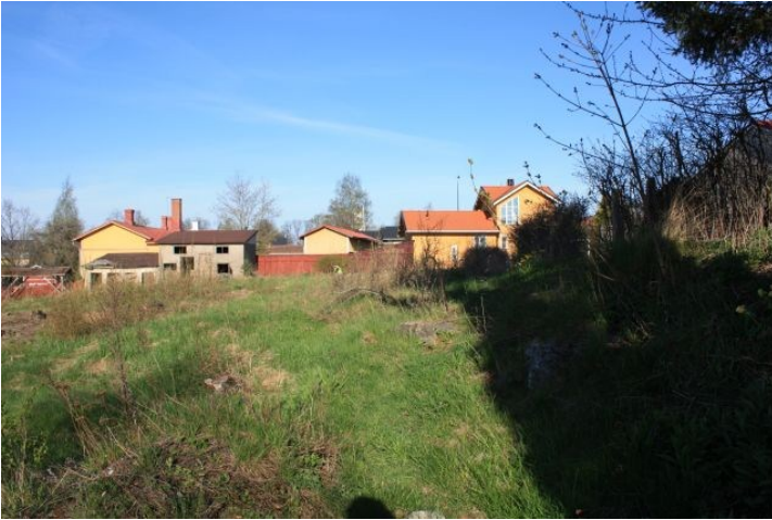
AKDG3158:9. Rauman Pohjankatu 20 tonttialuetta ennen tutkimusten alkua. Kuvattu tontin koillisnurkasta länteen.