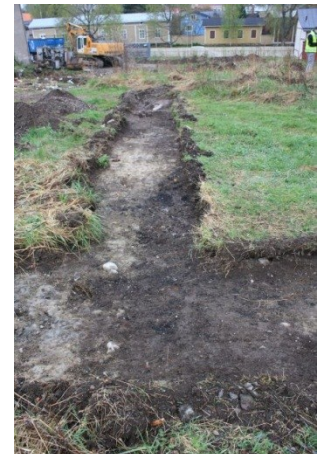
AKDG3158:14, 22, 15 ja 23. Vasemmalta oikealle: koeoja 1 kuvattuna idästä. Koeoja 1 sateen jälkeen kuvattuna lännestä. Koeoja 2 ennen puhdistusta kuvattuna pohjoisesta. Koeoja 2 tasossa 1 kuvattuna pohjoisesta.