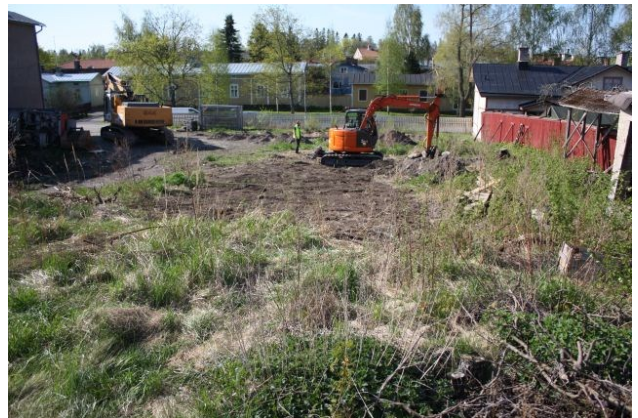
AKDG3158:46. Koeoja 3 eteläpään täyttöö. Kuvattu etelästä. Oikealla AKDG3158:47. Koeoja 3 täytettynä. Kuvattu pohjoisesta. Kuvat Esa Mikkola, Arkeologiset kenttäpalvelut