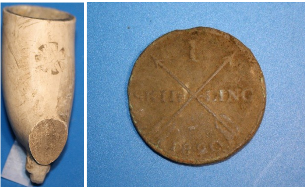
Koeojan 3 täytemaalöytöjä. Vasemmalla tähtileimakoristeinen liitupiipun pesä. Oikealla 1 skilling vuodelta 1820. Kolikko on kääntöpuolelta pahoin kulunut. Kuparikolikon löytöpaikan ETRS-TM35FIN koordinaatit p: 6789590,34, i: 204948,50, z: 6,11 m mpy.