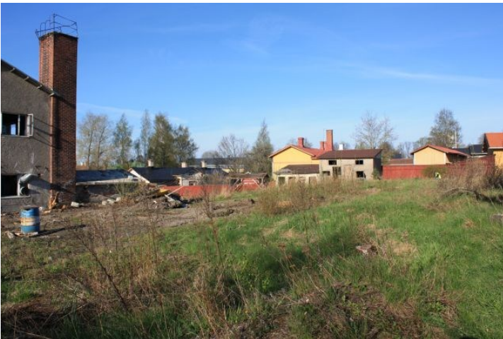
AKDG3158:8. Rauman Pohjankatu 20 tonttialuetta ennen tutkimusten alkua. Kuvattu tontin koillisnurkasta lounaaseen.