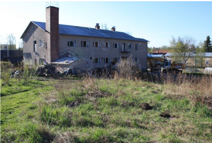
AKDG3158:2. Rauman Pohjankatu 20 tonttialuetta ennen tutkimusten alkua. Kuvattu tontin luoteisnurkasta kaakkoon.