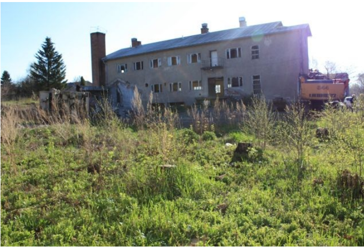
AKDG3158:5. Rauman Pohjankatu 20 tonttialuetta ennen tutkimusten alkua. Kuvattu tontin lounaisnurkasta koilliseen.