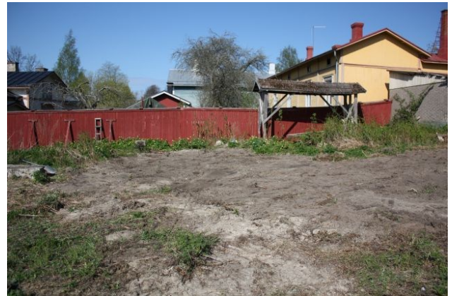
AKDG3158:44. Koeojan 4 kiveys poistettuna. Kuvattu länsilounaasta. Oikealla AKDG3158:45. Koeoja 4 täytettynä. Kuvattu idästä.

Koeoja 5 avattiin tontin lounaisosaan lähelle Pohjankatua NW-SW –suuntaisena. Koeoja oli noin 1,5 metriä leveä ja noin 17 metriä pitkä. Koeojan keskivaiheilta löydettiin laakakivistä tehty harva kiveys, jonka kohdalta koeoja laajennettiin 3 metriä leveäksi. Koeojan itäpäädyssä oli havaittavissa heti pihatoran poiston alla ohut, noin 5 cm paksuinen tummaksi värjäytynyt kerros, jonka alla oli 30 cm paksu puhtaan soran kerros, jossa oli paikoin suuria maakiviä. Sorakerroksen alla oli puhdasta vaaleaa savea. Sorakerros ja laakakiveys liittyivät rakennukseen, joka on merkitty vuoden 1962 peruskarttaan.