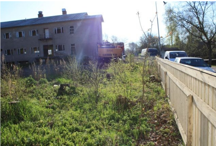
AKDG3158:6. Rauman Pohjankatu 20 tonttialuetta ennen tutkimusten alkua. Kuvattu tontin lounaisnurkasta itään.