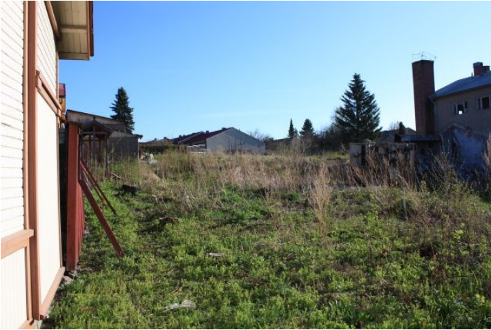
AKDG3158:4. Rauman Pohjankatu 20 tonttialuetta ennen tutkimusten alkua. Kuvattu tontin lounaisnurkasta pohjoiseen.