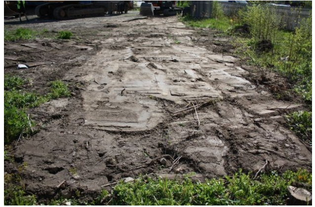
AKDG3158:31. Koeijan 5 kiveys tasossa 1. Kuvattu pohjoisesta. Oikealla AKDG3158:47. Koeija 5 täytettynä. Kuvattu lännestä.