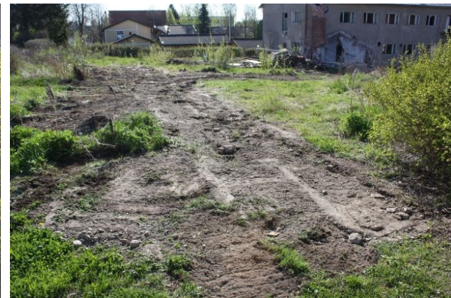
AKDG3158:10 ylhäällä vasemmalla, :11 ylhäällä oikealla, :13 alhaalla vasemmalla ja :42 alhaalla oikealla. AKDG3158:10 Työkuva koeojan avaamisesta kaivinkoneella. Kuvattu lännestä. AKDG3158:11. Koeojaa 1 puhdistamassa Ville Rohiola ja Petri Suomala. Kuvattu lännestä. AKDG3158:13 Koeojan 1 länsipää tasossa 1. Kuvattu lännestä. AKDG3158:42. Koeojat 1 ja 2 täytettyinä. Kuvattu länsiluoteesta.