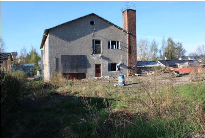
AKDG3158:7. Rauman Pohjankatu 20 tonttialuetta ennen tutkimusten alkua. Kuvattu tontin koillisnurkasta etelään.