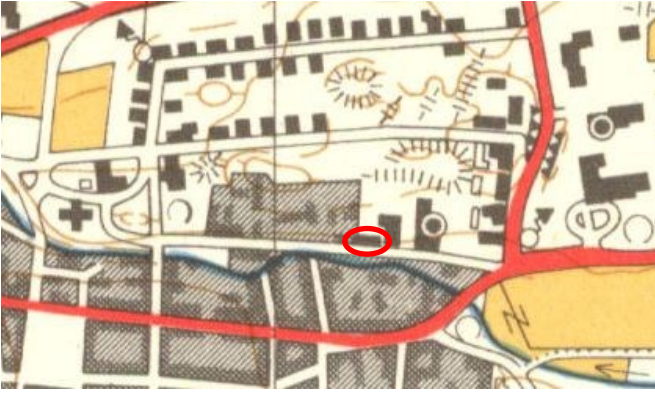
Ote vuonna 1962 painetusta peruskartasta 1132 08. Koeijan 5 kohdalla sijainnut rakennus on ympäröity punaisella.