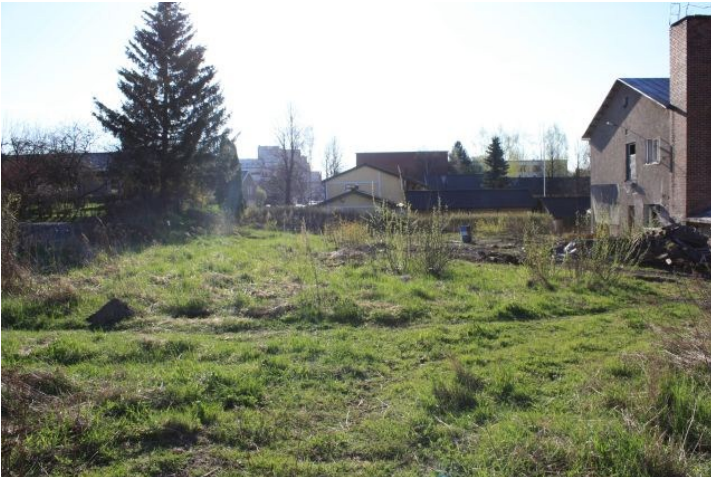
AKDG3158:3. Rauman Pohjankatu 20 tonttialuetta ennen tutkimusten alkua. Kuvattu tontin luoteisnurkasta itään.