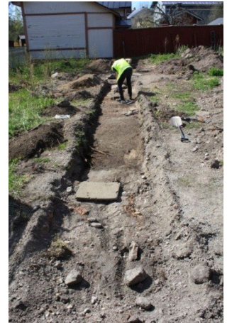
AKDG3158:19, 28, 30 ja 40. Vasemmalta oikealle: Koeija 5 ennen puhdistamista, kuvattu lännestä. Koeijan 5 itäpään jatke avattuna, kuvattu idästä. Koeijan 5 kiveys kuvattuna lännestä. Ville Rohiola tekee koeijan 5 kiveyksen itäpuolelle lapionpistoa, kuvattu idästä.