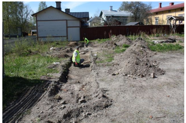
AKDG3158:31. Koeijan 5 kiveys tasossa 1. Kuvattu pohjoisesta. Oikealla AKDG3158:36. Työkuva koeijan 5 kaivamisesta. Kuvattu idästä.