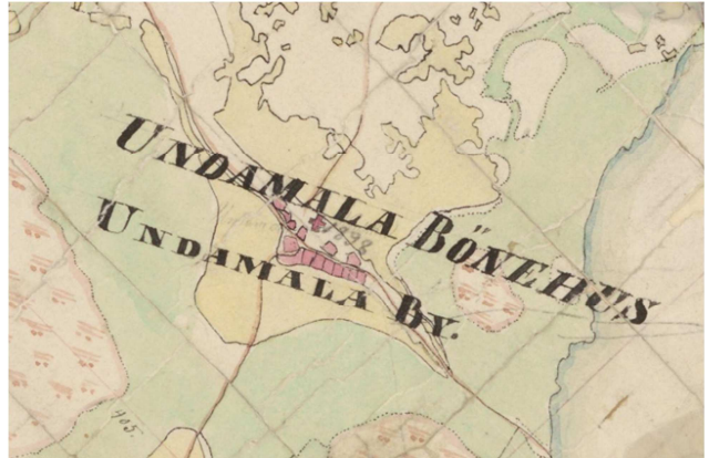
http://digi.narc.fi/digi/view.ka?kuid=1429689 Untamala, pitäjänkartta vuodelta 1848 (KA, 1131 11 la)