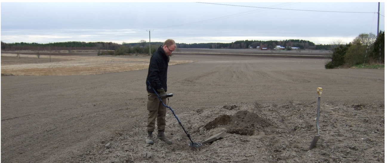
AKDG. 3691: 3

Tutkimusalue, taustalla oikealla Seikon uusittu latorakennus (suuli), jonka edustalla yksi purkuauto, kuvattu idästä.