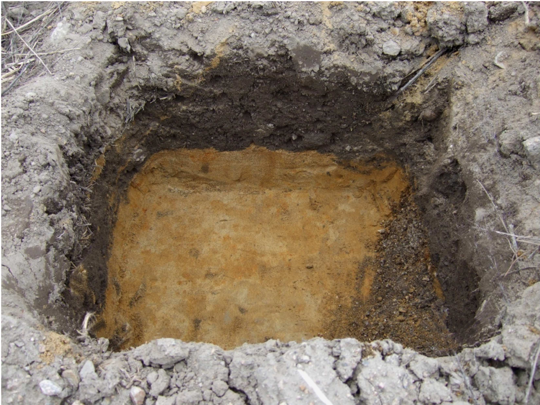
AKDG. 3691: 4

Koekuopassa 13 ruokamultakerroksen alla oli hienoa ja karkeaa ruskeaa hiekkaa, kuvattu etelästä.