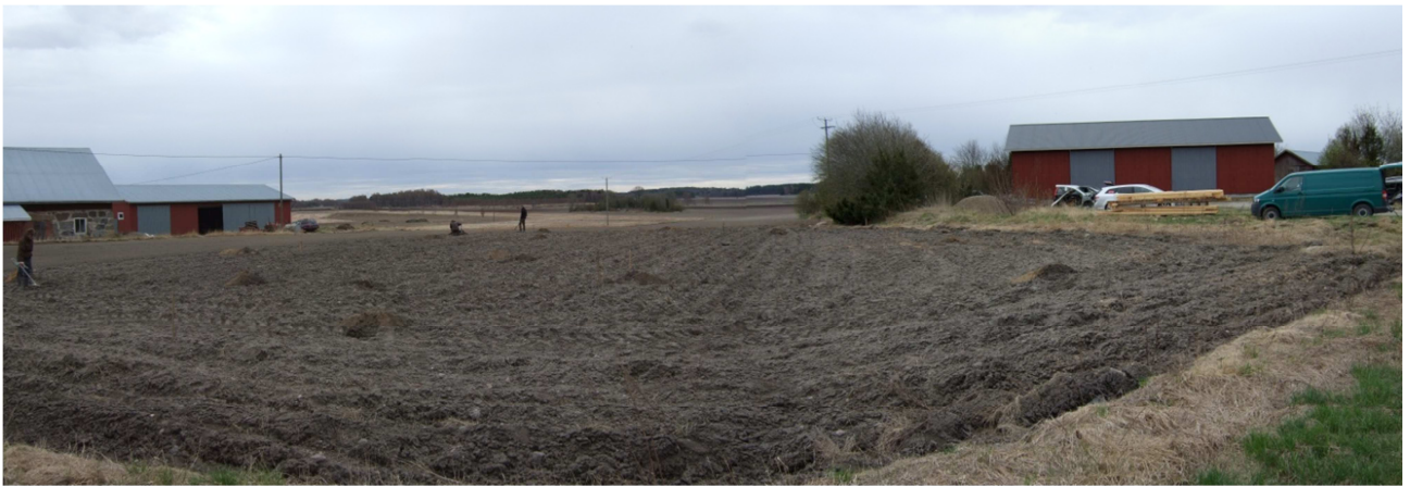
AKDG. 3691: 2

Tutkimusalue, taustalla navetan kohdalla Kirsi Luodon vuonna 2005 tutkima alue, kuvattu lännestä.