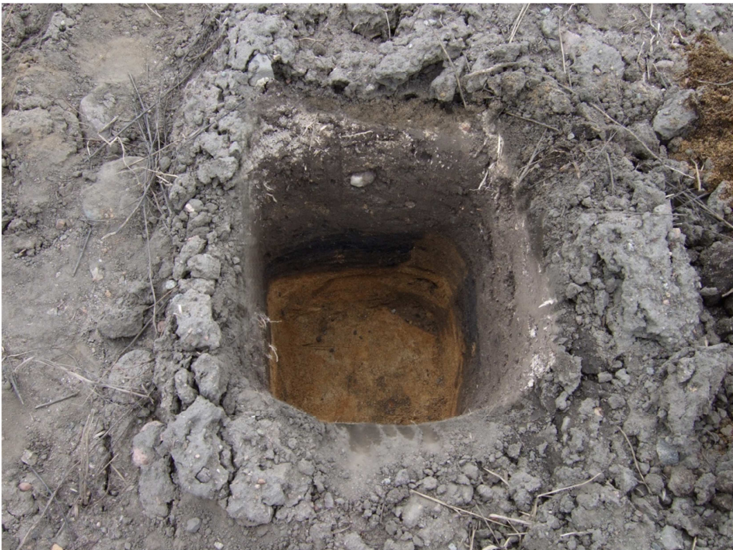
AKDG. 3691: 5

Koekuopassa 13 ruokamultakerroksen alla oli hienoa ja karkeaa ruskeaa hiekkaa, kuvattu etelästä.