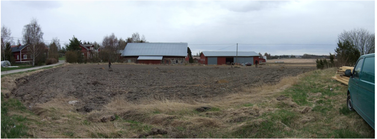
AKDG. 3691: 1

Tutkimusalue, taustalla navetan kohdalla Kirsi Luodon vuonna 2005 tutkima alue, kuvattu lännestä.