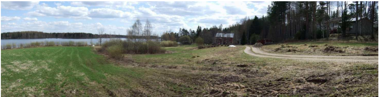
AKDG. 3692: 2

Tutkimusalueen luoteis- ja keskiosaa, vesi- ja viemäriinjo kulkee vasemmalla olevan rakennuksen oikealta puolelta, oikealla Savijärvi, taustalla vasemmalla Kannonniemi, kuvattu eteläkaakosta.