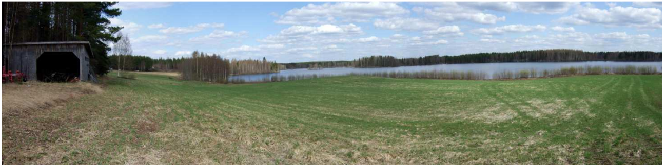
AKDG. 3692: 1

Tutkimusalueen luoteis- ja keskiosaa, vesi- ja viemäriinjo kulkee vasemmalla olevan rakennuksen oikealta puolelta, oikealla Savijärvi, taustalla vasemmalla Kannonniemi, kuvattu eteläkaakosta.