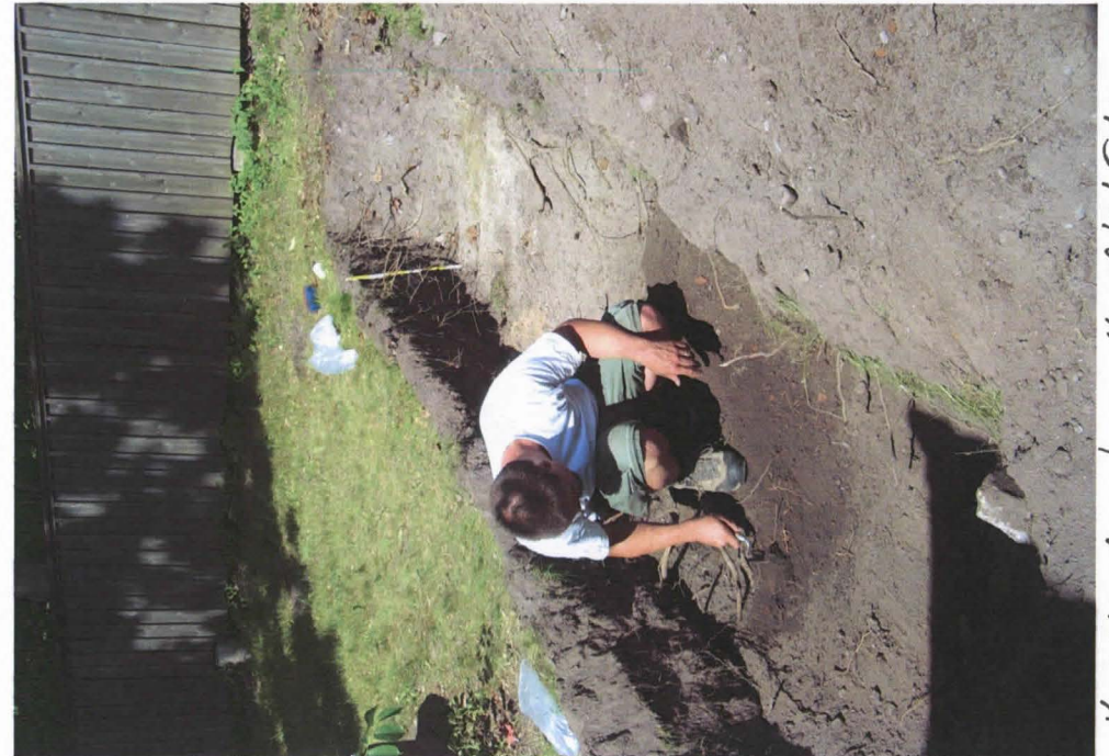
Koeoja 2, kuvattu etelästä