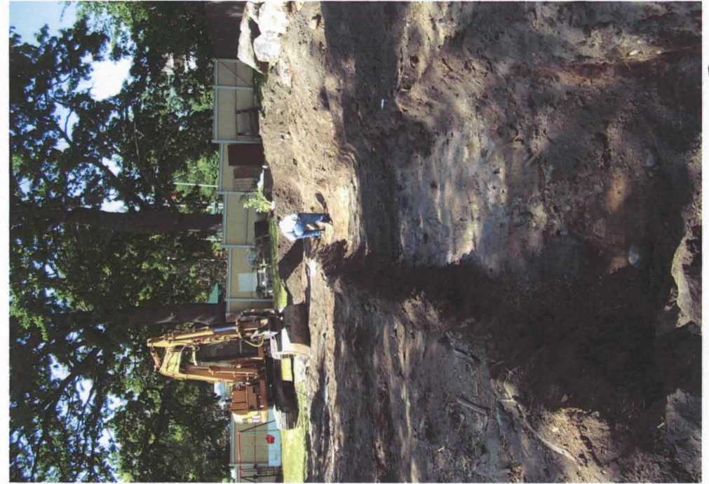
Koeoja 1, kuvattu idästä