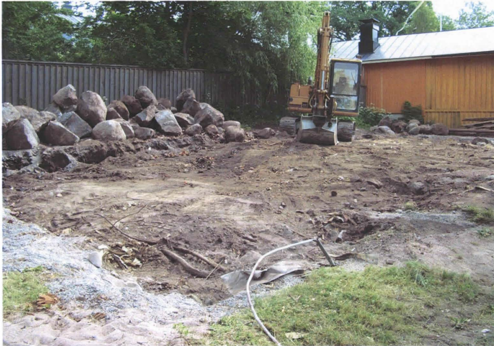
purettu piharakennuksen paikka