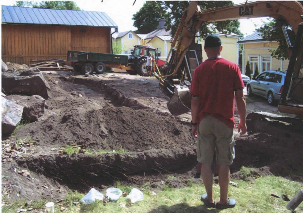
Etnalalla koeoja 2, taustalla koeoja 1