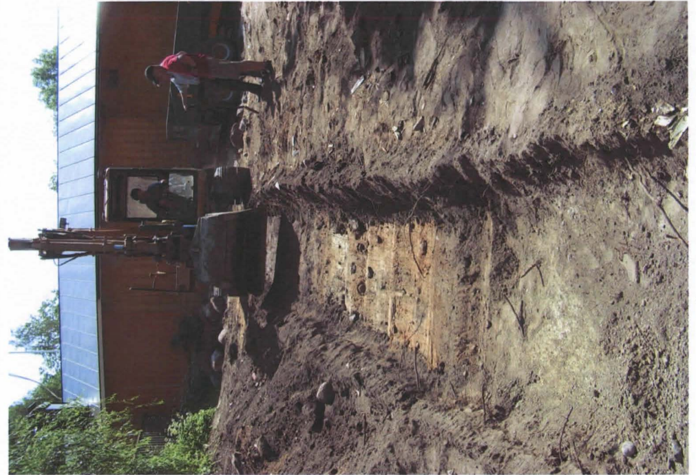
Koeoja 1, kuvattu lännestä