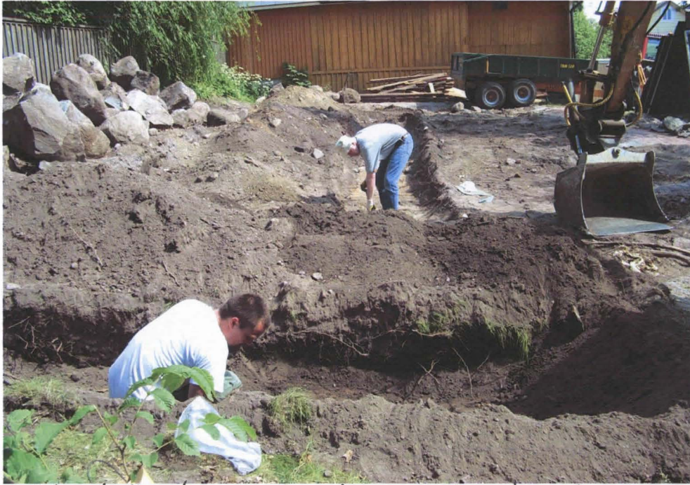
Etnalalla koeoja 2, taustalla koeoja 1