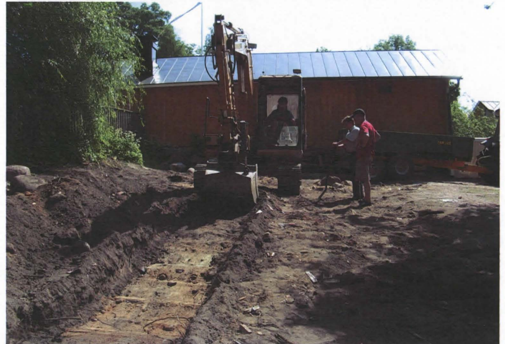
Koeoja 1:n avataan