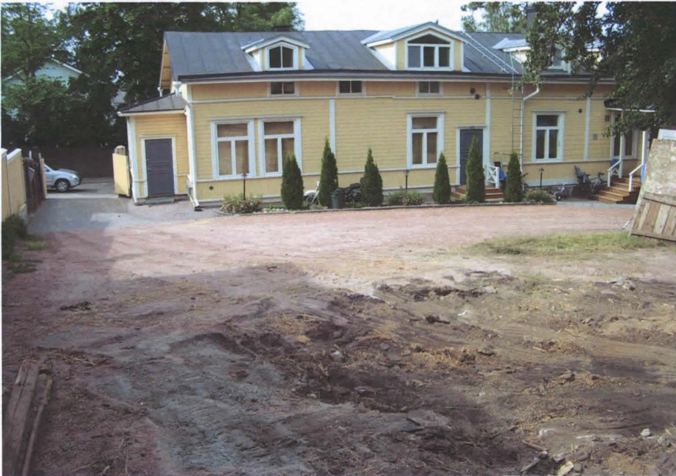
Tutkittava piha-alue, taustalla Kustaa Vaasan katu