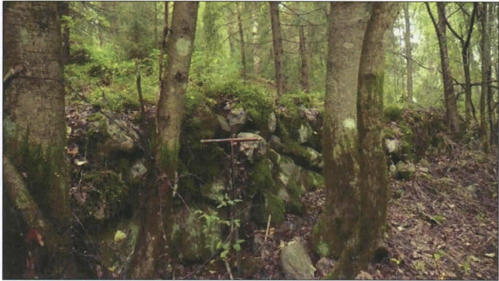
Kiviaita E, talon takana pusikkoisessa metsässä.