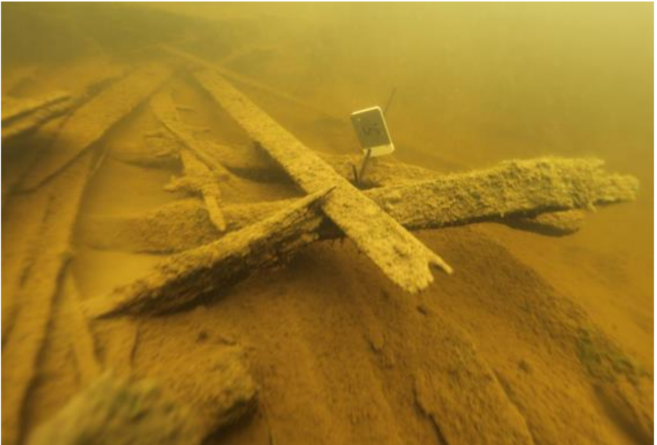
Kuva 6. Näytteet merkittiin hylkyyn numerolapuun. Kuvassa näytelappu numero 5 styrrpuurin puolen kylkikaassa. (AKMA201415:12).

Hylky dokumentoitiin kuvaamalla siitä videokuvaa ja still-kuvia. Sen jälkeen näytteenottoaikat merkittiin numerolapuun hylkyyn (kuvat 6. ja 7.). Hyllyn yli asetettiin pituussuunnassa yksi ja leveys-suunnassa kolme kelamittaa, jotka helpottivat hyllyn kuvaamista lohkoissa. Lisäksi perälaudan päälle asetettiin taittomitta mittasuhteiden ymmärtämisen helpottamiseksi. Hylystä kuvattiin vielä mittojen kanssa kattavasti videota ja still-kuvia. Hylystä otettiin yksityiskohtaisempia mittoja, jotta niiden ja kuvamateriaalin avulla siitä voitiin piirtää lähes tarkka luonnospirros.