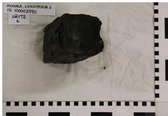
Kuva 4. Näyte 6 on kylkikaaresta styyrpuurin puolen kyljestä. (AKMA201415:21)