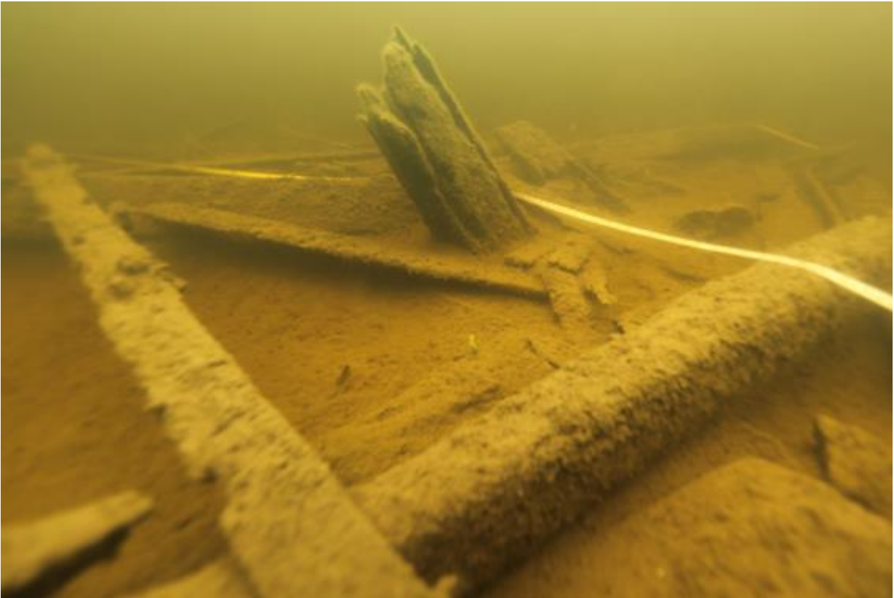
Kuva 8. Mahdollisesti mastonkenkään liittyvä rakenne keskilaivassa. (AKMA201415:9).