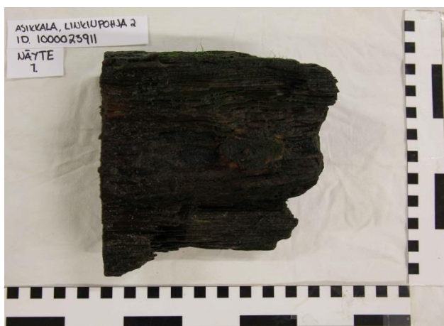
Kuva 1. Näyte 1. Perästeevin sisempi osa. (AKMA201415:16)

Hylystä otettiin yhteensä viisi näytettä, joista neljä lähetetään analysoitavaksi Lundin yliopiston dendrokrologiseen laboratorioon. Tutkittavaksi lähetetyistä näytteistä kolme otettiin kaarista ja yksi perärangasta (kuvat 1.-4.). Näytteet vaikuttivat ajoitettavilta. Yksi näyte hylättiin sen vähäisten lustomäärän vuoksi (kuva 5.). Tämä näyte otettiin paapuurin puolen kylkilankusta läheltä perärangaa.