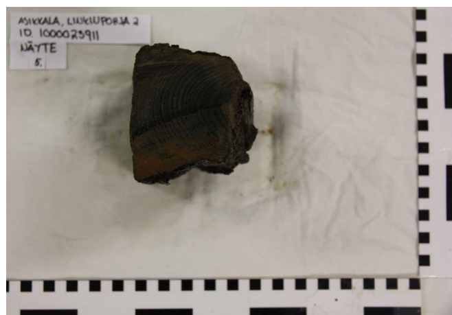
Kuva 3. Näyte 5 on kylkikaaresta styyrpuurin puolen kyljestä. (AKMA201415:23)