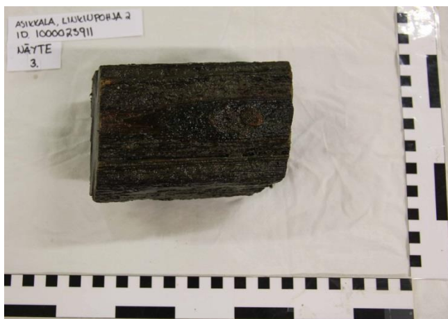
Kuva 2. Näyte 3. Näyte on paapuurin puolen kylkikaaresta. Kaari sijaitsee noin 7 metriä perästä kohti keulaa. (AKMA201415: 18)