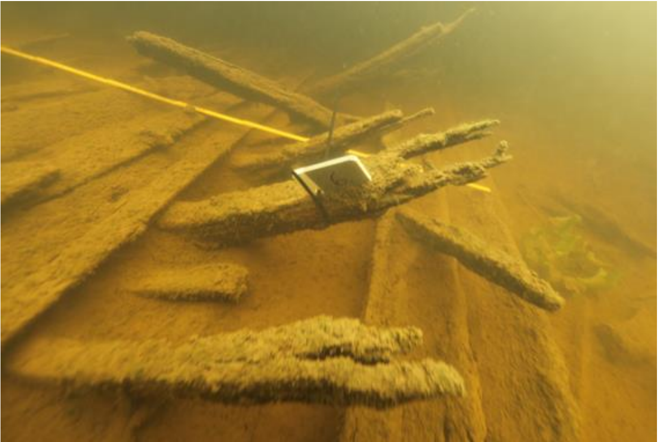
Kuva 7. Kuvassa näytelappu numero 6 styyrpuurin puolen kylkikaarissa. Taustalla taittomitta, jota käytettiin yksityiskohtaisen mittojen ottamiseksi. (AKMA201415:13).