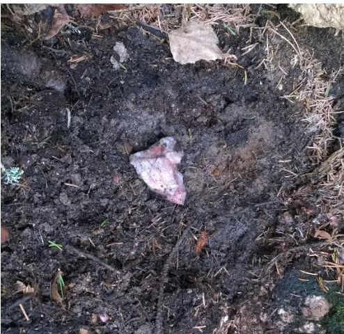
Kuva 11. Tuulenkaato 1: juonikvartsin pala.