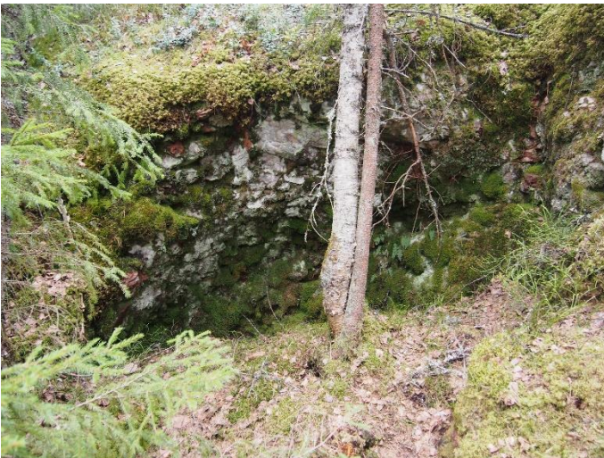
Kuva 9. Louhos 3. Kohti lounasta.