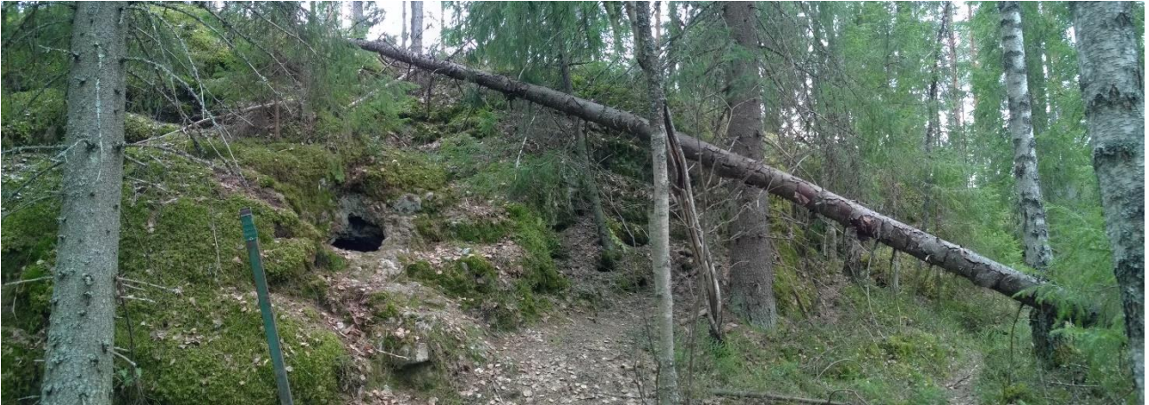
Kuva 4. Onkalon suuaukon alue. Louhos 1 suuaukon yläpuolella, louhos 2 siitä oikealle (kuvassa keskellä). Kohti länttä. Kuva T. Mökkönen 2015.