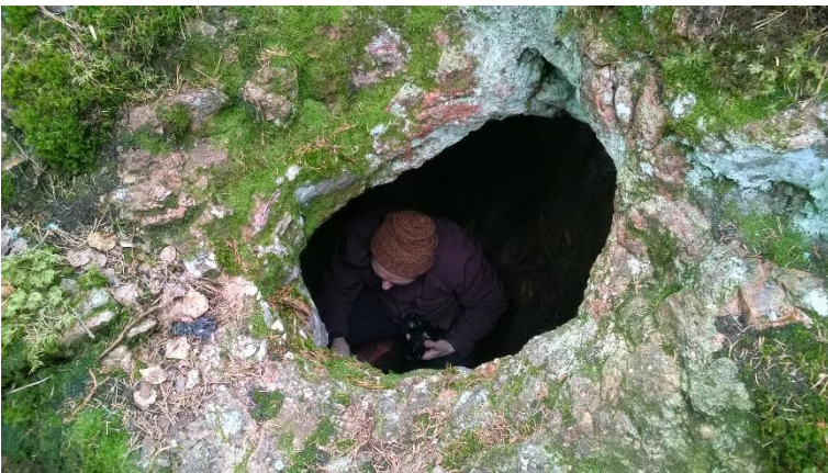
Kuva 3. Kuva onkalon sisälle.