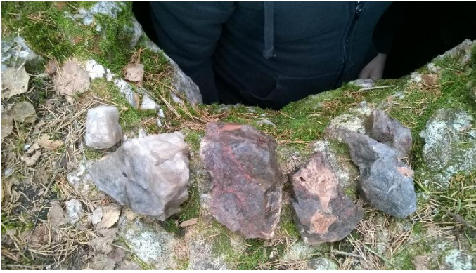
Kuva 7. Kvartsipaloja onkalon sisältä (palautettu paikalleen).