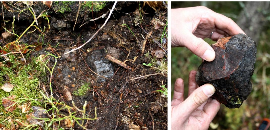
Kuva 12. Tuulenkaato 2: savukvartsikappale. Kappaleessa on näkyvissä sekä iskettyä pintaa että himmeää alkuperäistä pintaa. Kappaleessa näkyy myös sivukiveä (pegmatiitti), jota löytyy kideonkalon sisältä savukvartsin ja graniitin kontaktipinnasta. Kappale on peräisin kideonkalosta.