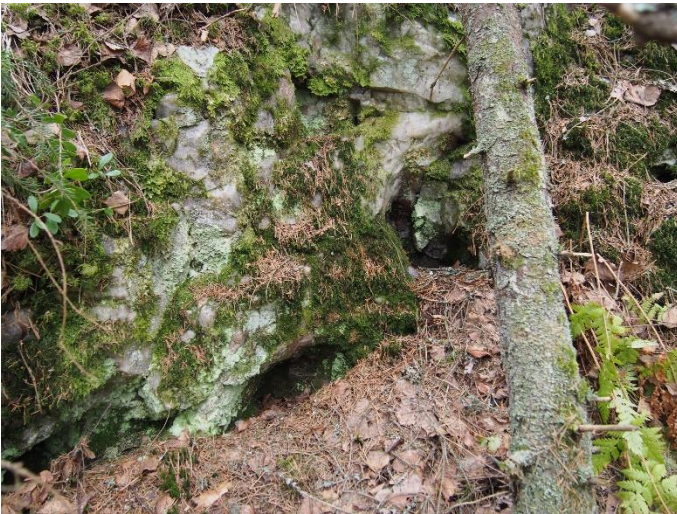
Kuva 8. Louhos 2. Kvartsia ja kaksi mahdollista pienikokoista kideonkaloa. Kuva T. Mökkönen 2015.