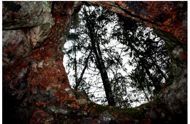
Kuva 4–6. Kuvia onkalon sisältä. Seinämissä on jäljellä hieman kvartsia ja savukvartsia.