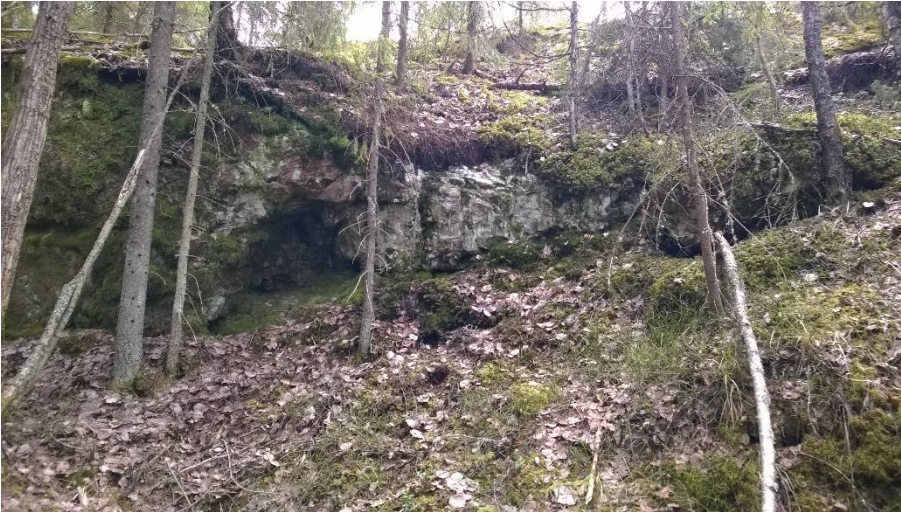
Kuva 10. Louhos 4. Kohti lounasta. Kuva T. Mökkönen 2015.