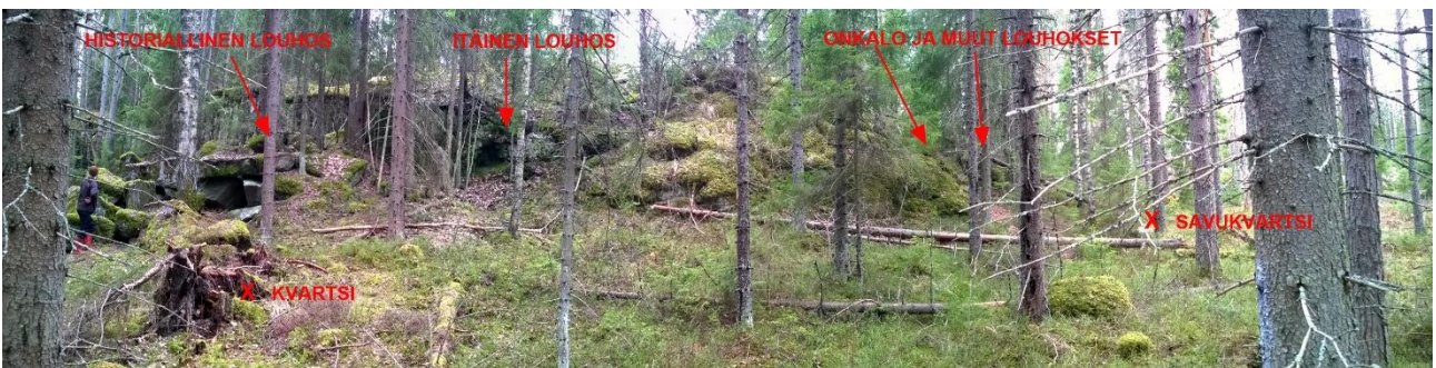
Kuva 2. Yleiskuva. Onkalo ja sen kaakkoispuolella sijaitsevat louhokset (louhos 4 = "itäinen louhos", historiallinen louhos) ja edustalta tehdyt löydöt (tuulenkaato 1: kvartsi ja tuulenkaato 2: savukvartsi) merkittynä kuvaan. Kohti etelää/lounasta.