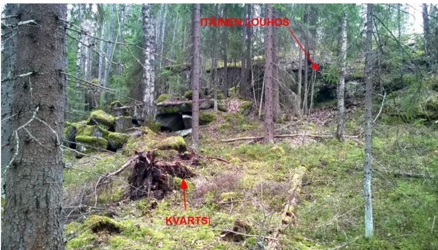
Kuva 3. Yleiskuva. Louhos 4 ("itäinen louhos", historiallinen louhos) ja edustalta tehdyt löydöt (tuulenkaato 1) merkittynä kuvaan. Kohti etelää/lounasta.