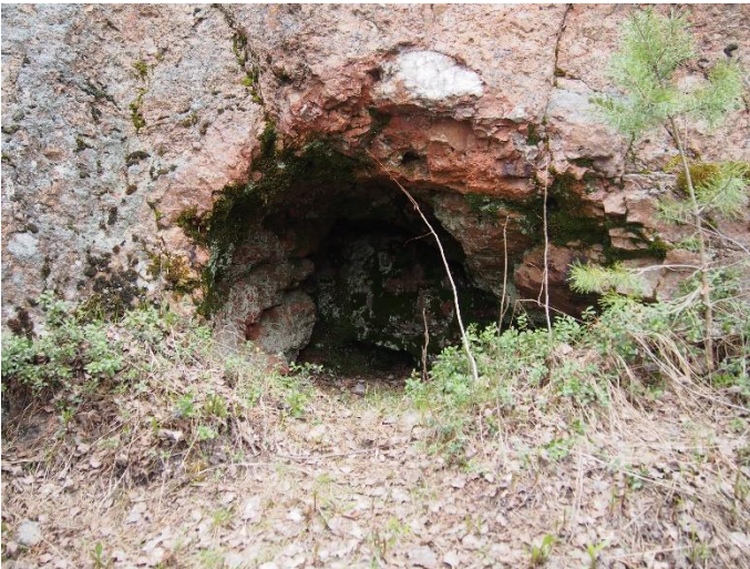
Kuva 2. Lähikuva Luoperinvuoren kideonkalosta.