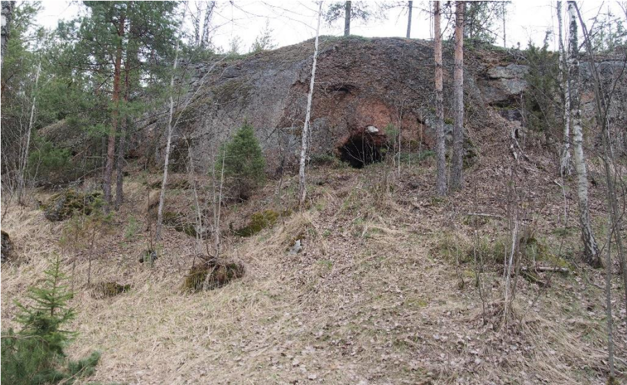
Kuva 1. Luoperinvuori, yleiskuva. Kohti koillista. Kuva T. Mökkönen 2015.