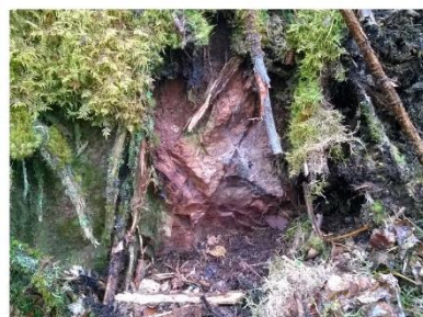
Kuva. Metsäkylän seuratalo, louhos 5 ja 4. Etuvasemmalla erottuu porfyrylouhos (louhos 5) sammalten alta osin paljastettuna (oikeanpuoleinen kuva). Taaempänä oikealla louhitun kvartsijuonen paikka (louhos 4). Kuva kohti luodetta. T. Mökkönen 2015.