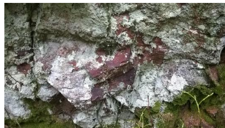
Kuva. Metsäkylän seuratalo, louhos 8. Louhos 8 sijaitsee kalliokumpareen etelärinteeseen yläosassa, louhoksesta 7 hieman itään. Louhos on pohjaltaan neliömäinen, ja saattaa siten ajoittua historialliselle ajalle. Kuva kohti pohjoista. T. Mökkönen 2015.