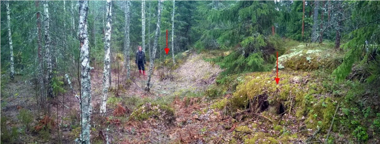
Kuva. Metsäkylän seuratalo, louhos 5 ja 6. Taaempänä louhos 6, ja etuoikealla louhos 5. Kuva kohti kaakkoa-etelää. T. Mökkönen 2015.