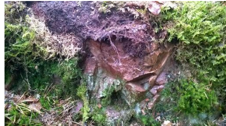
Kuva. Metsäkylän seuratalo, louhos 7. Louhos sijaitsee kalliokumpareen etelärinteeseen yläosassa. Louhos on pohjaltaan neliömäinen, ja poikkeaa siten muualta porfyryrjuonen alueelta löydetyistä louhospaikoista. Oletettavasti tien lähellä sijaitseva louhos on ollut käytössä historiallisella ajalla. Paikasta kymmenisen metriä länteen sijaitsee pieni kotitarpeeseen (kivijalat) tehty graniittilouhos. Kuva kohti pohjoista. T. Mökkönen 2015.