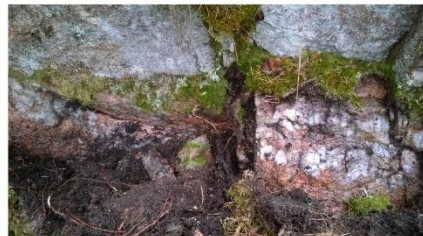
Kuva. Metsäkylän seuratalo, louhos 4. Kallion korkeimmalla kohdalla vai porfyryjuonen länsireuna erottuu, itäreunan ollessa jääkauden tasaiseksi silottamaa. Paikalta havaittiin kvartsia pystysuorassa kalliossa, jonka alapuolelta sammaleen ja turpeen alta paljastui kvartsijuoni. Kvartsijuonesta on louhittu pala pois, ja paikalla oli muutama iskos. Kuva kohti luodetta.