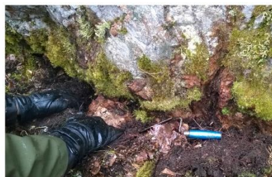
Kuva. Metsäkylän seuratalo, louhos 6. Louhittu porfyriitti oli voimakkaasti kasvillisuuden peittämää, mutta turpeen alta louhinnan merkit paljastuivat selvästi. Kuva kohti koillista. T. Mökkönen 2015.