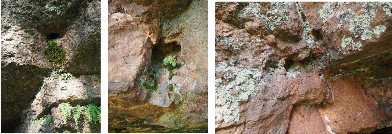
Kuvat. Pienikokoisia kideonkaloita luolan seinämissä. Kuvat T. Mökkönen 2015.