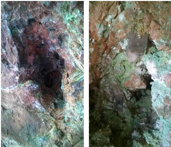
Kuvat. Kvartsin ja savukvartsin jäänteitä luolan katosta. Oikeanpuoleisessa kuvassa näkyy irrotetun kidesauvan kanta. T. Mökkönen 2015.