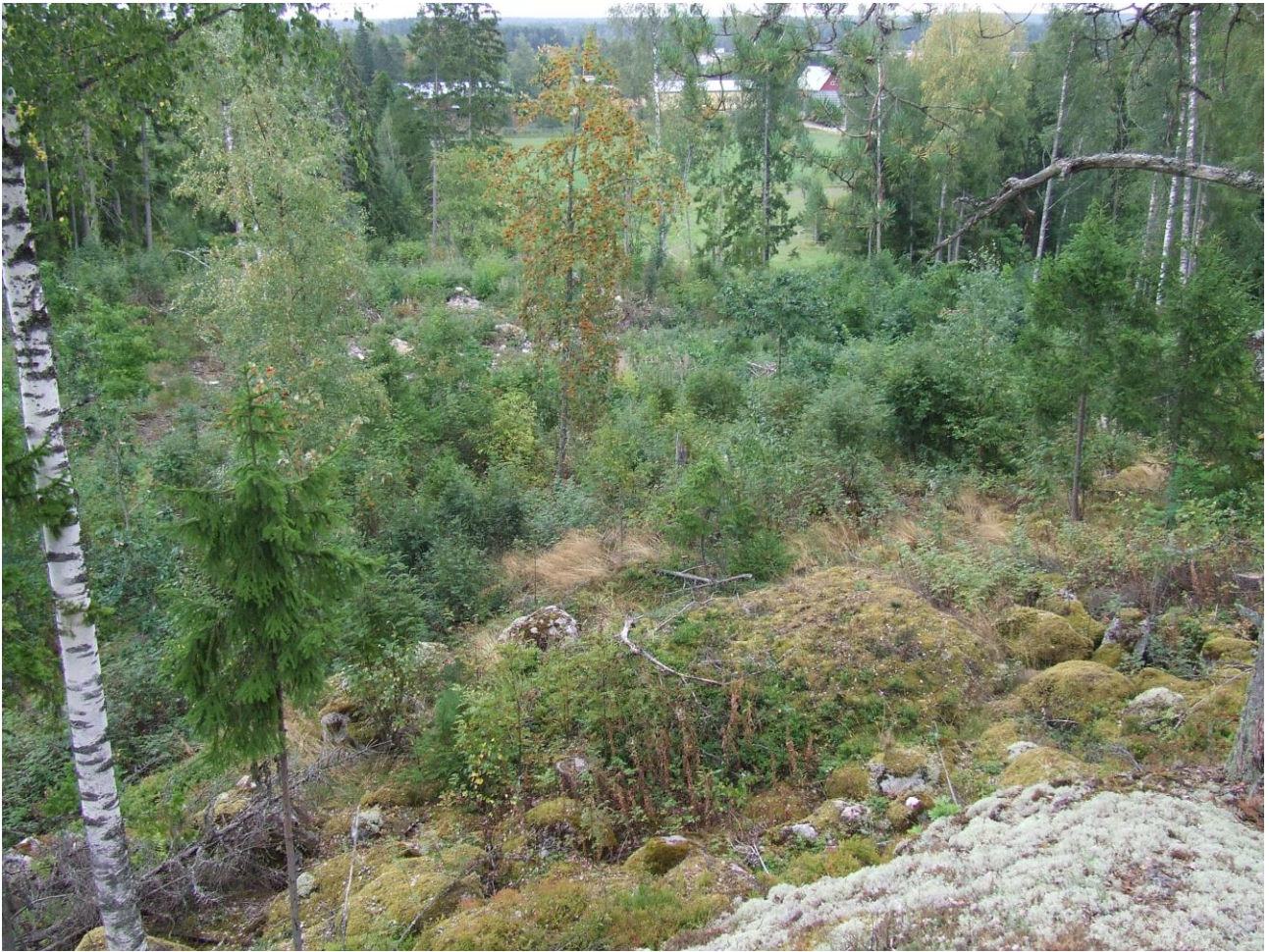
Linnavuoren itäjuuren terassi kallion päältä kuvattuna. Löytöalue kuvan keskivaiheilla. Kuvattu itään.