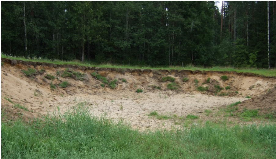
Eteläiset kvartsien löytöpaikat matalan hiekkakuopan reunalta, kuvattu pohjoisluoteesta. RM.

Tarkastettu kvartsi-iskosten löytöpaikka sijaitsee 13,1 km eteläkaakkoon Jalasjärven kirkosta, Koskutjoen itäpuolen korkean rantatörmän päällä (ks. kansilehden kuva: Männikkö 1 kivikautinen asuinpaikka, maisema Kotkutjoen uomalle ja länsirannalle, panoraama kuvattu idästä). Jo aikaisemmin tunnettu Männikkö 1 -asuinpaikka rajautuu pellon eteläpuolella olevaan pieneen hiekkakuoppaan ja pohjoispuolella metsään ja purouoman reunaan. Koskutjoen itäpuolen pitkällä törmäalueelta on löytynyt runsaasti kivikautisia löytöjä. Nykyinen joenuoma on lähes 15 metriä alempana kuin törmä. Alueen maaperä on enimmäkseen hienoa hiekkaa. Törmällä sijainneet useat kivikautiset asuinpaikat ovat osittain tuhoutuneet peltojen muokkaustöissä.