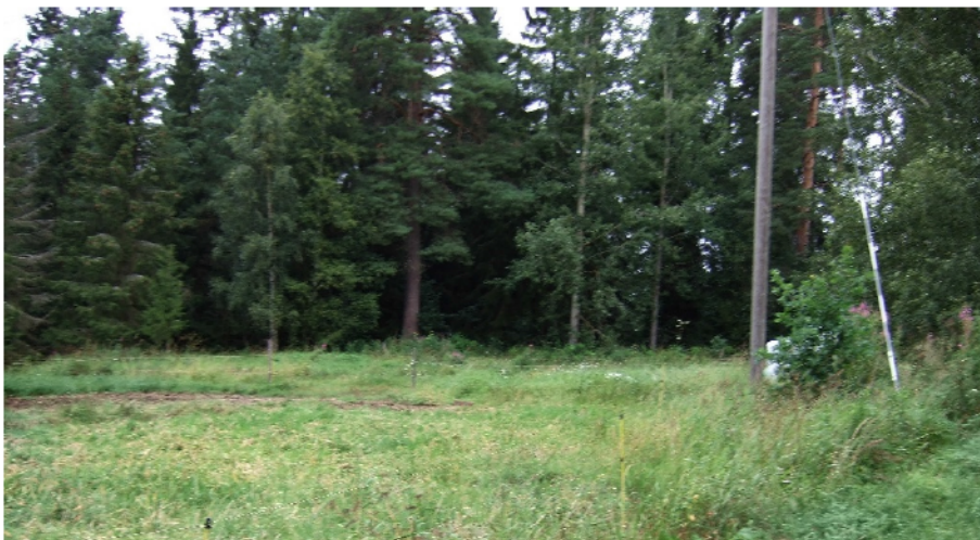
Pohjoinen kvartsi-iskosten löytöpaikka, kuvattu eteläkaakosta. RM.